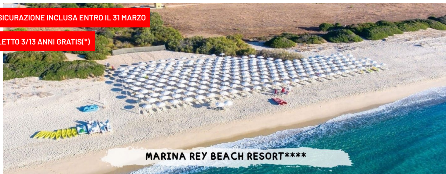
MARINA REY BEACH RESORT****