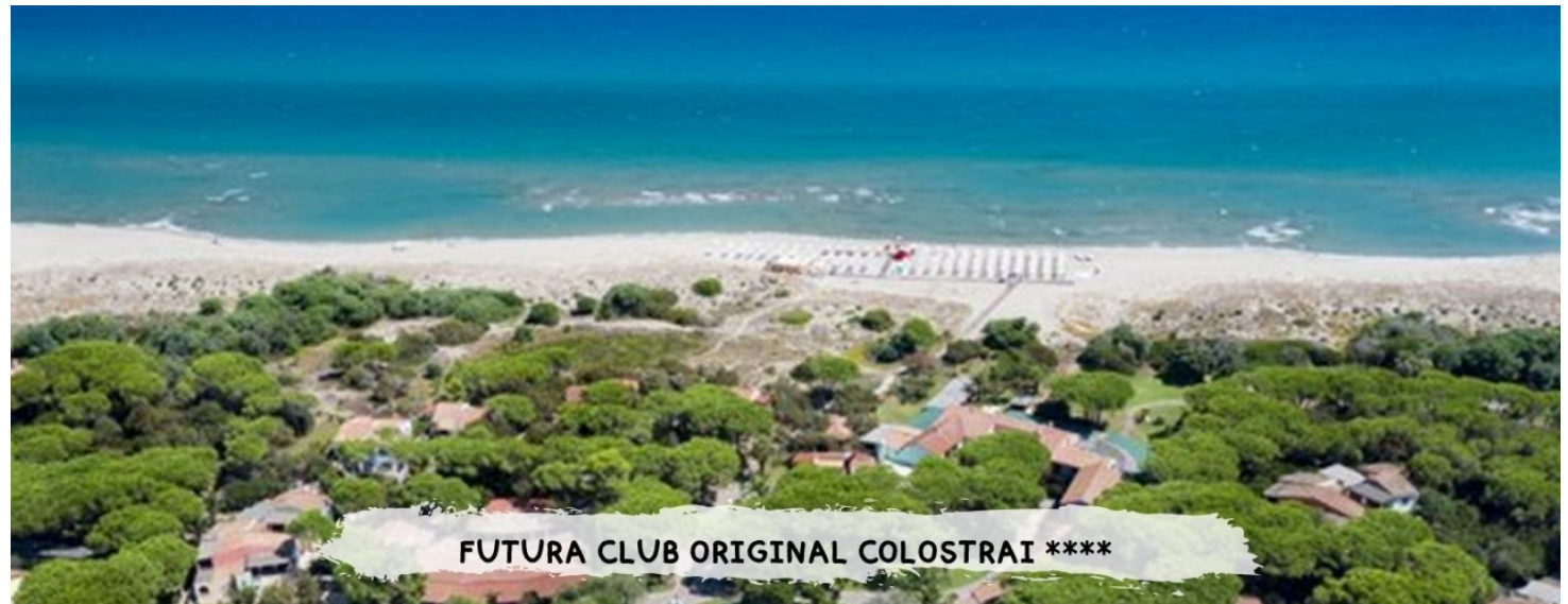
Quote settimanali per persona in camera Classic in Soft All Inclusive