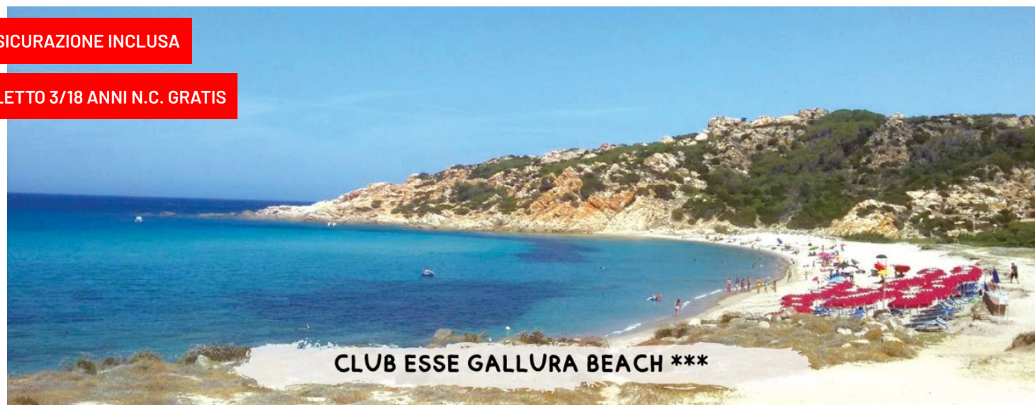
CLUB ESSE GALLURA BEACH ***