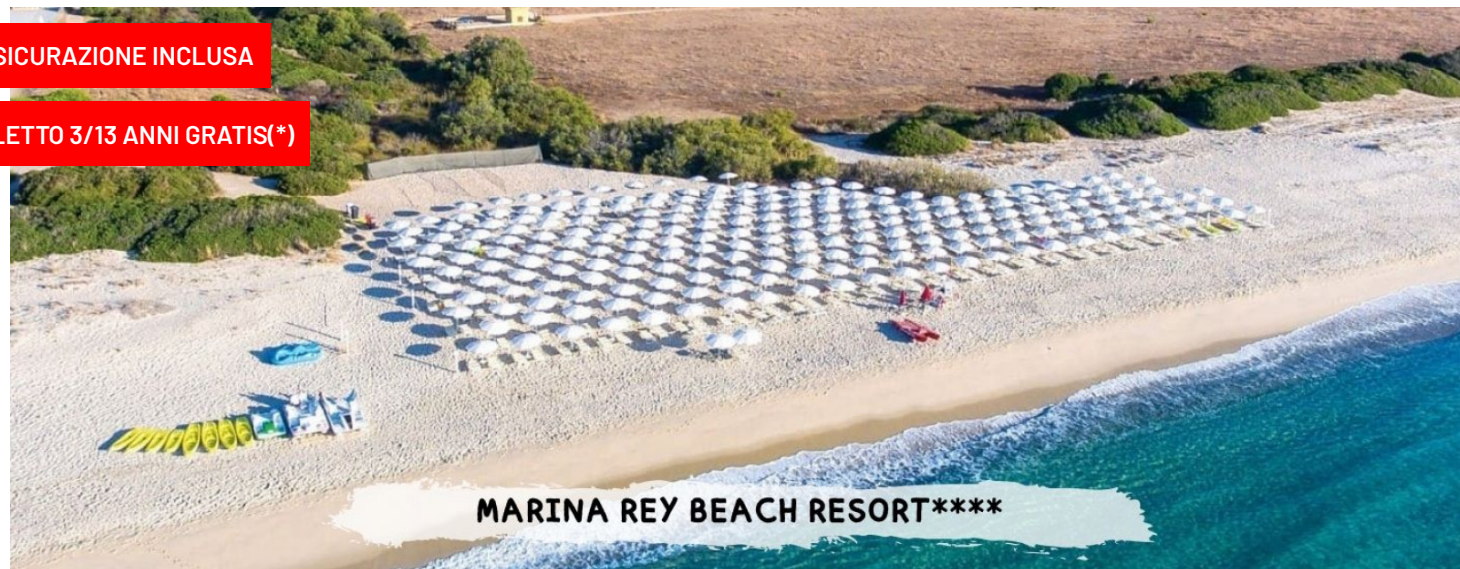
MARINA REY BEACH RESORT****